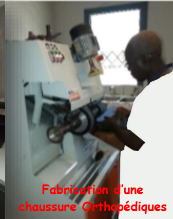
Fabrication d'une chaussure Orthopédiques

Nos techniciens sont à votre entière disposition du Lundi au Vendredi, de 7 heures à 14 heures