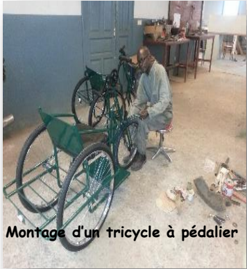
Montage d'un tricycle à pédalier