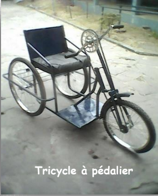
Tricycle à pédalier