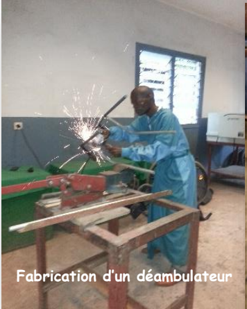
Fabrication d'un déambulateur