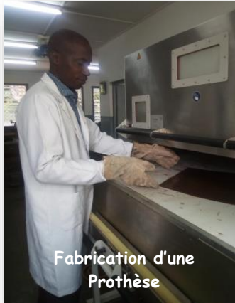
Fabrication d'une Prothèse